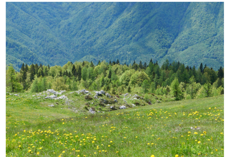
사진 4 = 초원의 야생화 (조밥나물)

초원으로 난 평평한 오솔길을 가다 보면 멀리 독일 가문비나무 숲이 보이고 초원 일부에는 노랑, 하양 그리고 보라색 꽃들이 가득 자라고 있어 마치 꽃밭에 들어선 것처럼 느껴진다. 또한 오두막집 띄엄띄엄 자리를 잡고 있어 목가적인 풍경을 자아낸다. 초원 지대에는 노랑색 금매화, 조밥나물과 자주색 물망초, 용담 등이 자라고 있어 더 친숙해 보인다. 초원 위의 나지막한 언덕을 지나 안으로 더 들어가면 오두막집 수십 채가 들어서 있는 목동마을이 나타난다. 마을 건너편 언덕 위에는 눈의 성모 마리아