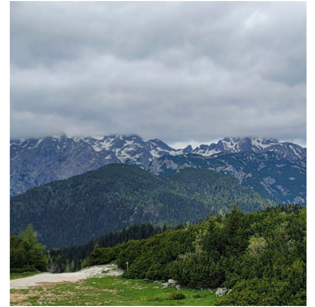
사진 9 = 낙엽송 독일가문비 혼효림