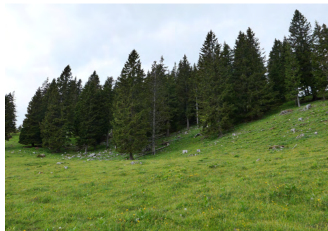
사진 3 = 고원지대 초지와 독일 가문비나무

전통 목동 마을에는 가문비나무 판자로 만든 낮은 지붕의 타원형 지붕을 가진 독특한 건축 양식의 오두막(Bajta)이 140여 채 있는데 전통적인 거주공간으로 확장된 지붕의 빈공간은 가축을 보호하기에 적합하다. 마을에서 프레스카르 박물관(Preskar's Hut)과 눈의 성모 마리아 예배당이 있다. 마을에는 상주 주민이 거의 없지만, 여름철(6월~9월)에는 목동들이 소를 방목하며 거주한다. 이 목동 마을은 유럽에서 이 규모로 보존된 몇 안 되는 목축민 마을 중 하나로, 겨울에는 스키, 여름에는 하이킹을 즐길 수 있는 시설을 갖추고 있다.