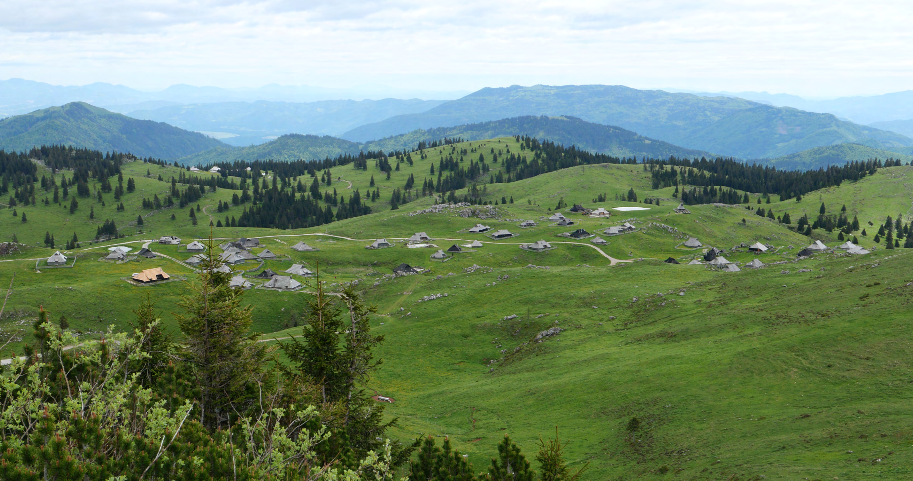
사진 1 = 전통 목동 마을 전경