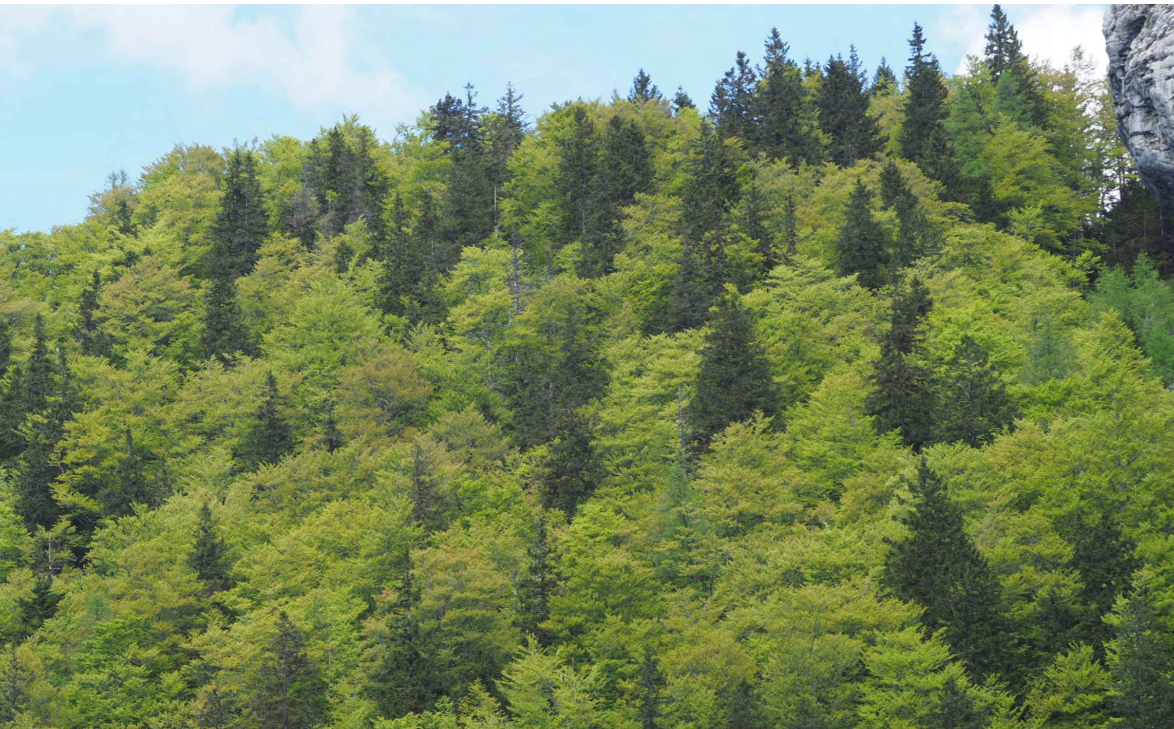
사진 10 = 독일가문비 너도밤나무 혼효림

벨리카 플라니나는 해발 1,500~1,600m 지대에서는 고원 초원지대로 전통적인 산악지 목축과 목동 마을을 체험 할 수 있는 곳인 동시에 등산 및 스키를 즐길 수 있는 스포츠 지역이기도 하다.