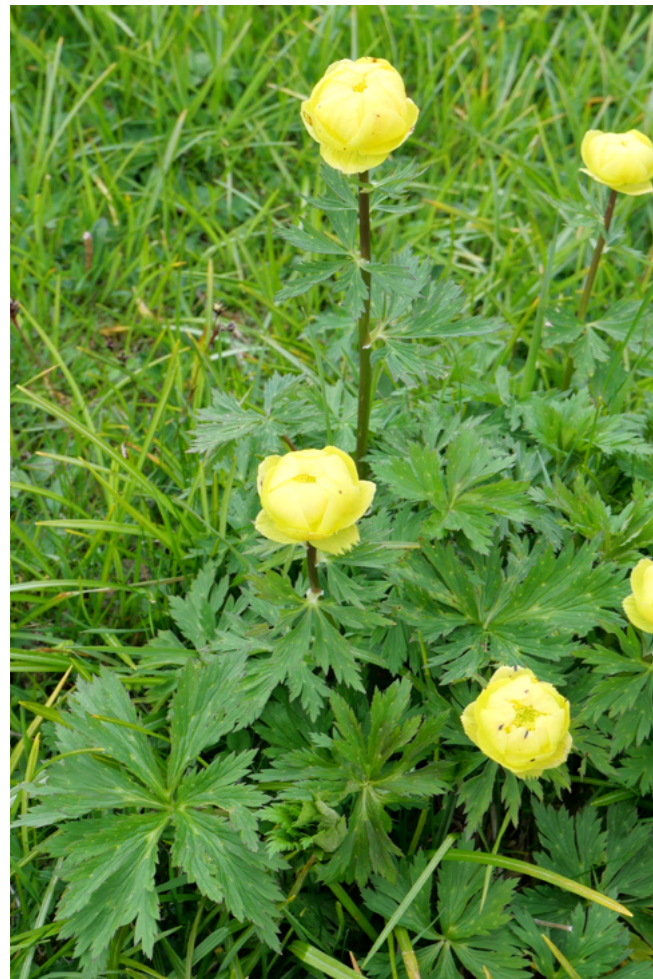
사진 5 = 초원의 야생화 (금매화)

정상 북서쪽으로는 높다란 바위 산들이 줄지어 서있는데 제일 왼쪽에는 캄니크-사비냐 알프스에서 가장 높은 그린토베츠(Grintovec, 2,558m)이 있고, 그 오른쪽으로는 스퀴타(Skuta 2,532m), 플란야바(Planjava, 2394m)가 줄지어 자리 잡고 있다. 해발이 높은 산이 어서인지 늦은 봄까지 정상부와 정상부 계곡에 늦봄까지 하얀 눈이 남아있는 것을 보면 이 지역이 스키 지역이라는 것을 알 수 있다.