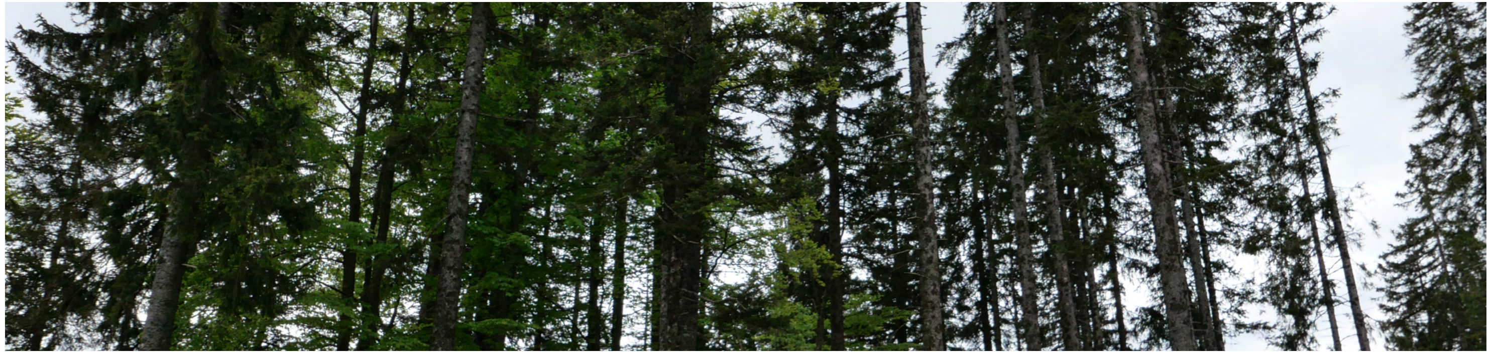
사진 2 = 주차장 주변 독일 가문비나무 숲

전통 목동 마을에는 가문비나무 판자로 만든 낮은 지붕의 타원형 지붕을 가진 독특한 건축 양식의 오두막(Bajta)이 140여 채 있는데 전통적인 거주공간으로 확장된 지붕의 빈공간은 가축을 보호하기에 적합하다. 마을에서 프레스카르 박물관(Preskar's Hut)과 눈의 성모 마리아 예배당이 있다. 마을에는 상주 주민이 거의 없지만, 여름철(6월~9월)에는 목동들이 소를 방목하며 거주한다. 이 목동 마을은 유럽에서 이 규모로 보존된 몇 안 되는 목축민 마을 중 하나로, 겨울에는 스키, 여름에는 하이킹을 즐길 수 있는 시설을 갖추고 있다.