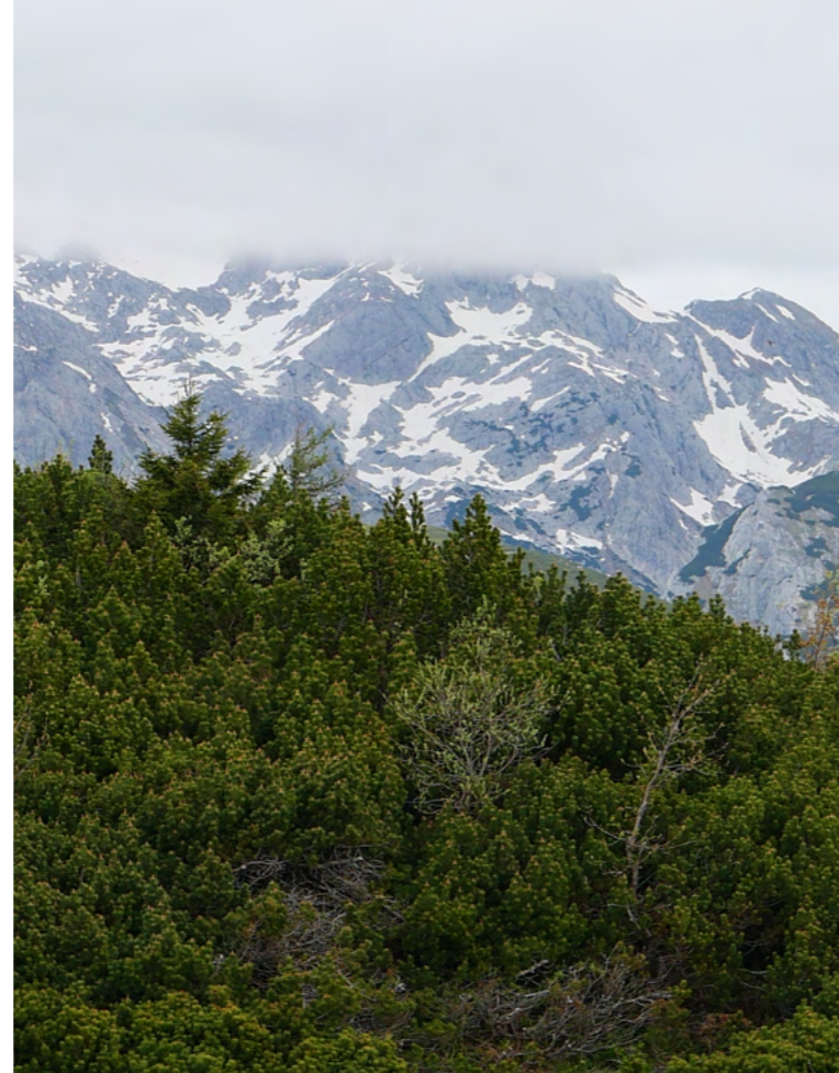
사진 6 = 그라디슈체의 무고 소나무

숲 아래쪽 햇빛이 많이 드는 공간에는 고산지대에 자라는 보랏빛 꽃이 피는 높이 30~4cm의 윈터 히스 (Winter Heath)가 양탄자처럼 바닥을 가득 채우고 있고 중간 중간에 초록빛 유럽 블루베리가 자라고 있다. 아래로 더 내려가면 회색빛 줄기의 너도밤나무와 독일 가문비가 울창한 숲을 이루고 있는데 연초록 너도밤 나무 사이에 서있는 짙은 초록빛 독일 가문비나무가 좋은 대조를 이루고 있다.