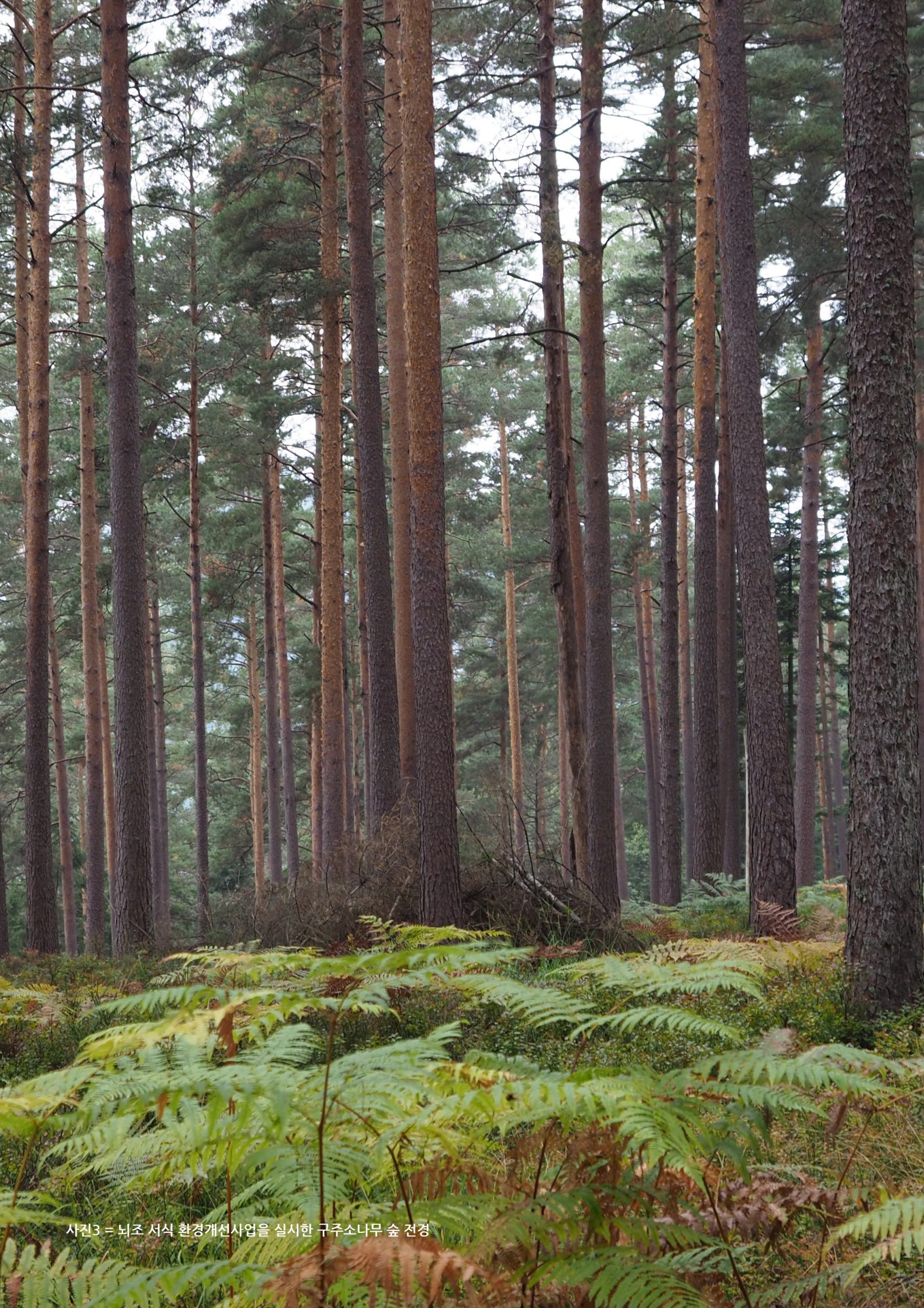
사진3 = 뇌조 서식 환경개선사업을 실시한 구주소나무 숲 전경