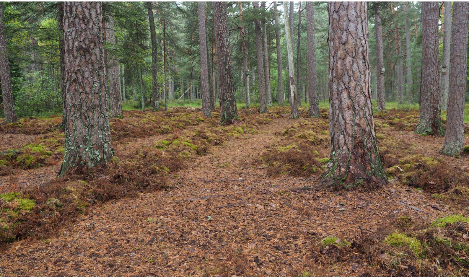
사진4 = 헤젤미스(Heselmiss) 보호림의 숲바닥