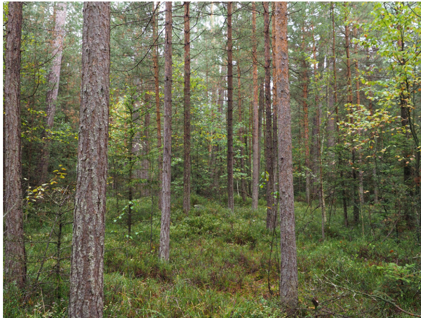
사진6 = 뇌조 서식 환경개선사업을 미실시한 구주소나무 숲 전경