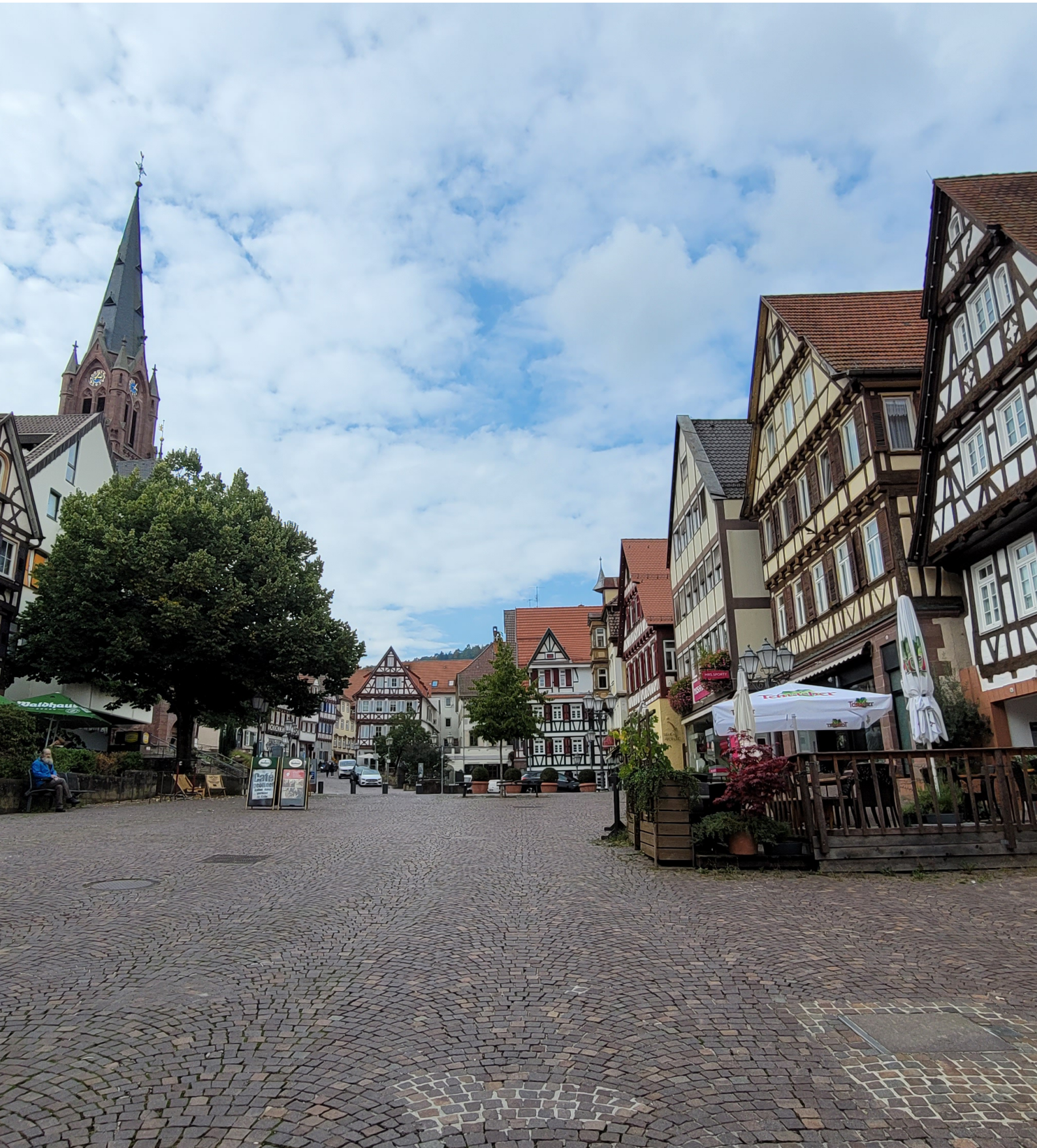
사진1 = 칼프(Calw) 구시가지 전경