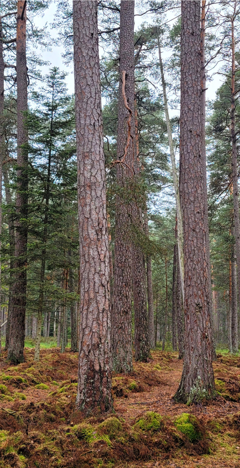
사진3 = 헤젤미스(Heselmis) 보호림 전경