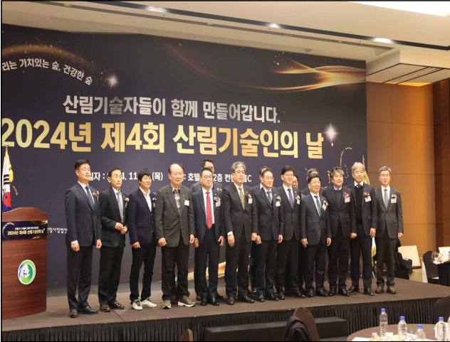
사진1 = 한국산림기술인회는 지난 28일 호텔CC에서 '2024년 제4회 산림기술인의 날' 기념행사를 개최했다.