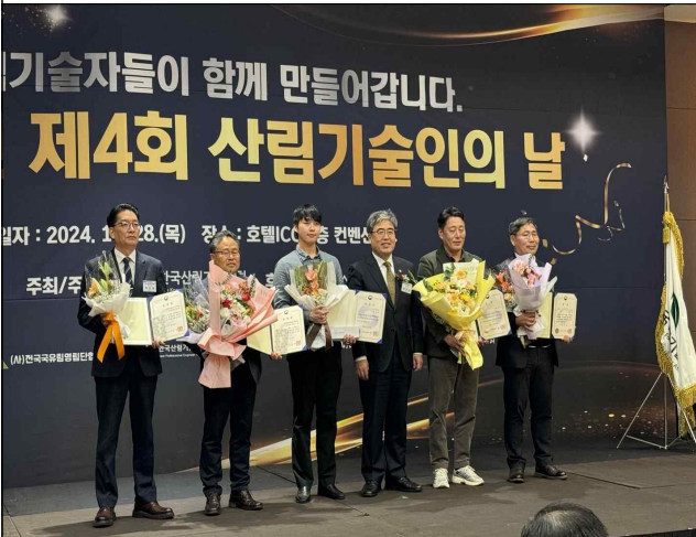
사진3 = 임상섭 산림청장이 지난 28일 '2024년 제4회 산림기술인의 날' 포상자들과 기념촬영을 하고 있다.