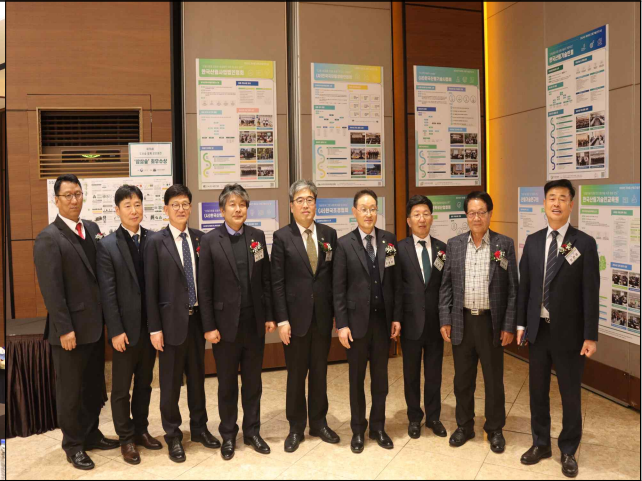
사진2 = 지난 28일 '2024년 제4회 산림기술인의 날' 기념행사에 참석한 주요 내빈들이 기념촬영을 하고 있다.