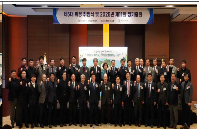
사진2 = 25일 한국산림기술인회 제5대 회장 취임식에 참석한 주요내빈들이 기념촬영을 하고 있다.