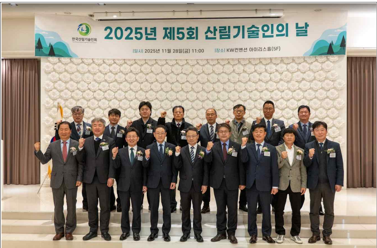
사진 = 지난 11월 28일 한국산림기술인회 '제5회 산림기술인의 날' 주요 내빈들이 기념촬영을 하고 있다.

- 산림 관련 주요 내빈 100여명 참석 ... 기념행사 및 표창식 진행 -