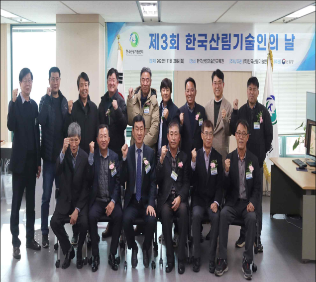
<사진4> 제3회 산림기술인의 날 주요 내빈 단체사진.