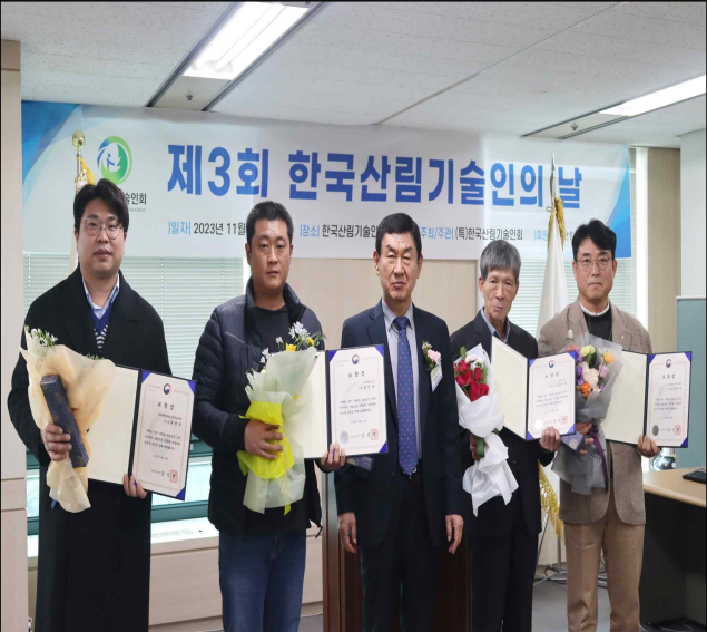
<사진2> 산림청장상 수상자들이 기념촬영을 하고 있다.