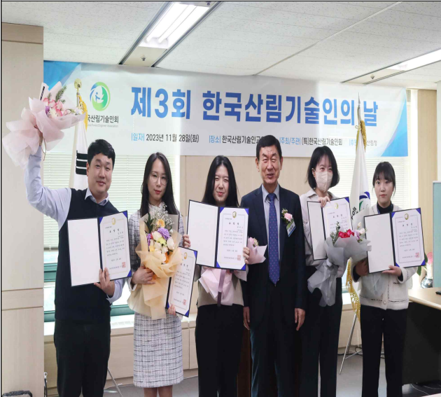
<사진3> 한국산림기술인회장상 수상자들 모습.